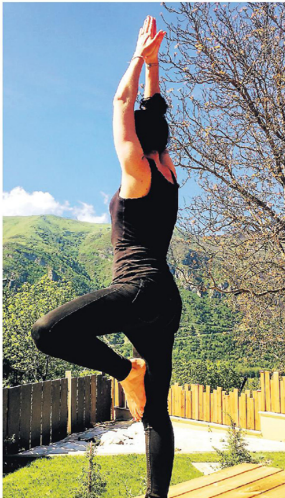
Premier objectif du stage: prendre son temps dans un paysage inspirant.

Tous les ingrédients étaient réunis pour que leur séjour soit un succès. « Objectif premier, prendre son temps ! », an-